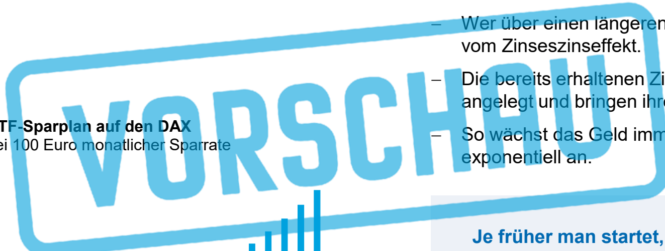
Thesaurierender ETF-Sparplan auf den DAX Vermögensentwicklung bei 100 Euro monatlicher Sparrate